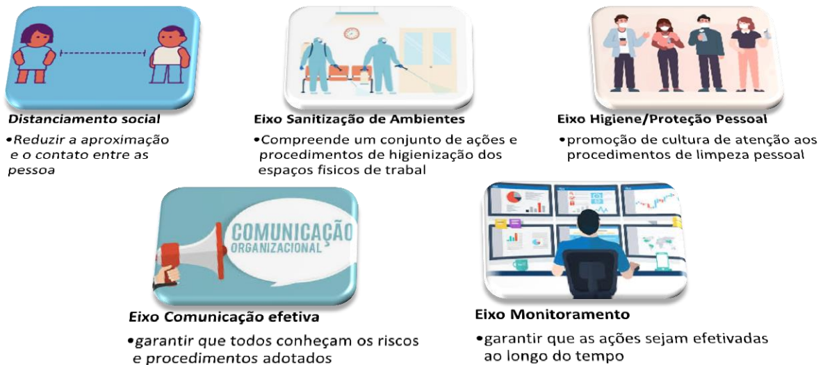
Figura 1 – Eixos do Plano de Retomada

Os eixos que orientarão as ações a serem implementadas estão descritos na figura a abaixo: