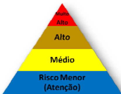
Figura 2 – Pirâmide de Risco Ocupacional - OSHA

Classificar o risco de exposição do corpo funcional ao SARS-COV-2 de acordo com a pirâmide de risco de ocupacional elaborado pela Occupational Safety and Health Administration - OSHA, que classifica os riscos em: MUITO ALTO, ALTO, MÉDIO e MENOR.